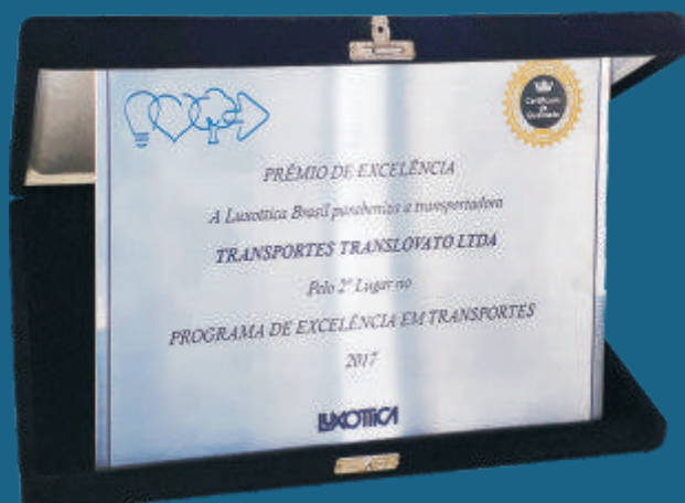
Prêmio de Excelência da Luxottica