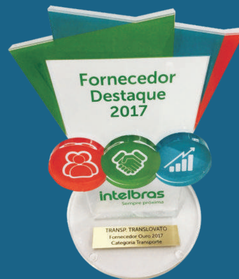
Fornecedor Destaque Intelbras