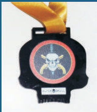
Transportador “Tropa de Elite” GDS

Neste ano de 2018 já recebemos quatro premiações! O reconhecimento da qualidade dos serviços prestados é motivo de orgulho para todos os profissionais da empresa, pois reafirma e reforça a dedicação e compromisso de cada um com a satisfação dos clientes.