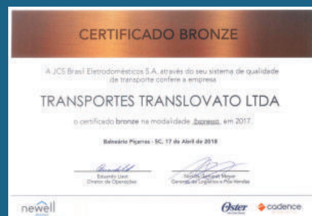
Certificado Bronze JCS