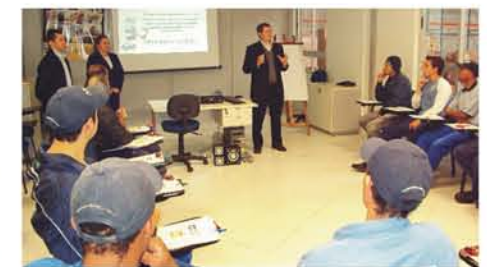
Desenvolvimento de Conferentes