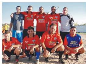
Equipe Translovato B