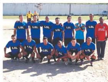
Equipe Translovato A Noite