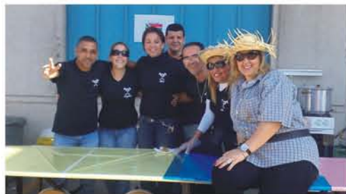
Comissão de Eventos - SAO