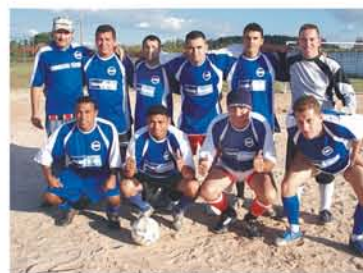
Equipe Translovato Dia