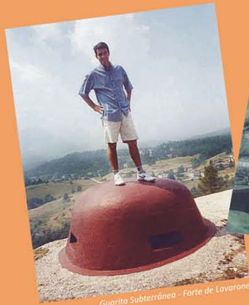
Guarita Subterrânea - Forte de Lavarone

Pegando um trem em direção à Alemanha, chegamos a Munique, onde, até hoje, estão enterrados os corpos dos soldados que morreram em batalhas nas fronteiras da Itália/Áustria e Alemanha. Ao lado do estádio de futebol do Bayer de Munique, existe uma praça com muitas ondulações no solo, ali estão os milhares de soldados mortos de diversas nacionalidades.