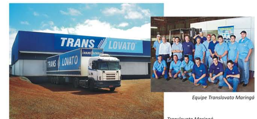
Equipe Translovato Maringá

Parabéns e sucesso a toda equipe de Maringá.