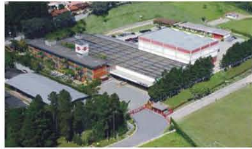
WURTH DO BRASIL