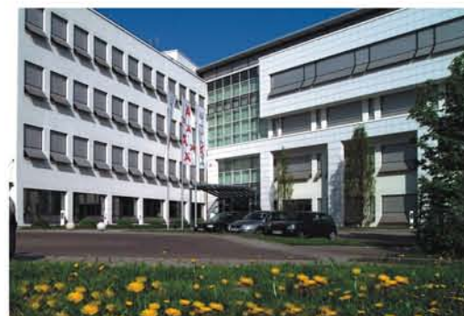
HÄFELE Matriz em Nagold

A Häfele é uma empresa multinacional com sede em Nagold, na Alemanha. Fundada em 1923, a empresa atende a indústria de móveis, arquitetura, projetistas e revendas, fornecendo ferragens para móveis e construção civil, além de sistemas de fechaduras eletrônicas.