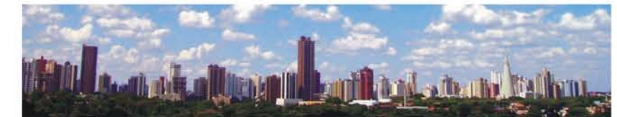
Maringá - PR