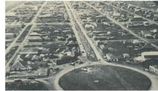
Maringá - PR / Década de 50