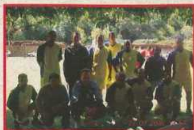
Equipe Bebecê e Translovato