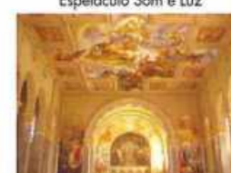
Igreja de São Pelegrino