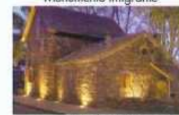
Casa de Pedra