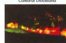
Espetáculo Som e Luz