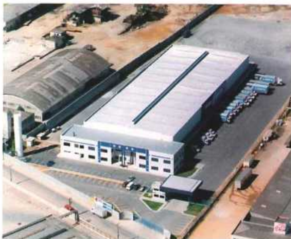
Vista aérea Filial São Paulo

A unidade chama atenção dos que a visitam: elogiam sua estrutura, beleza e é motivo de orgulho para todos que fazem parte desta equipe. Muito já foi feito, ainda há muito a se fazer, pois a Translovato é partidária do conceito que tudo pode ser melhorado e este terminal é a evidência que somos uma empresa em franco crescimento. Estamos assegurando nosso lugar no mercado, firmando esta marca e buscando atingir nossa Visão que é "Ser a Melhor Empresa de Transportes de Cargas e Encomendas nos Estados do Rio Grande do Sul, Santa Catarina, Paraná e São Paulo".