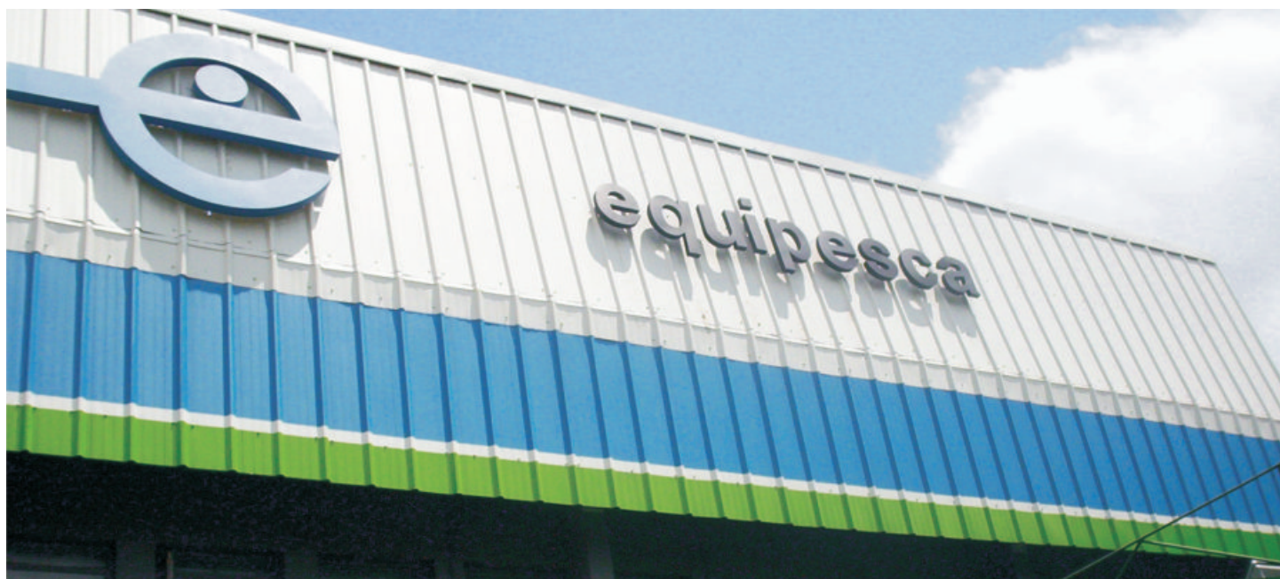
Equipisca - Campinas/SP

Comprometimento com a qualidade, esta é a missão da Equipisca, que desde sua fundação, em 1960, consolidou sua posição como pioneira em tudo o que faz.