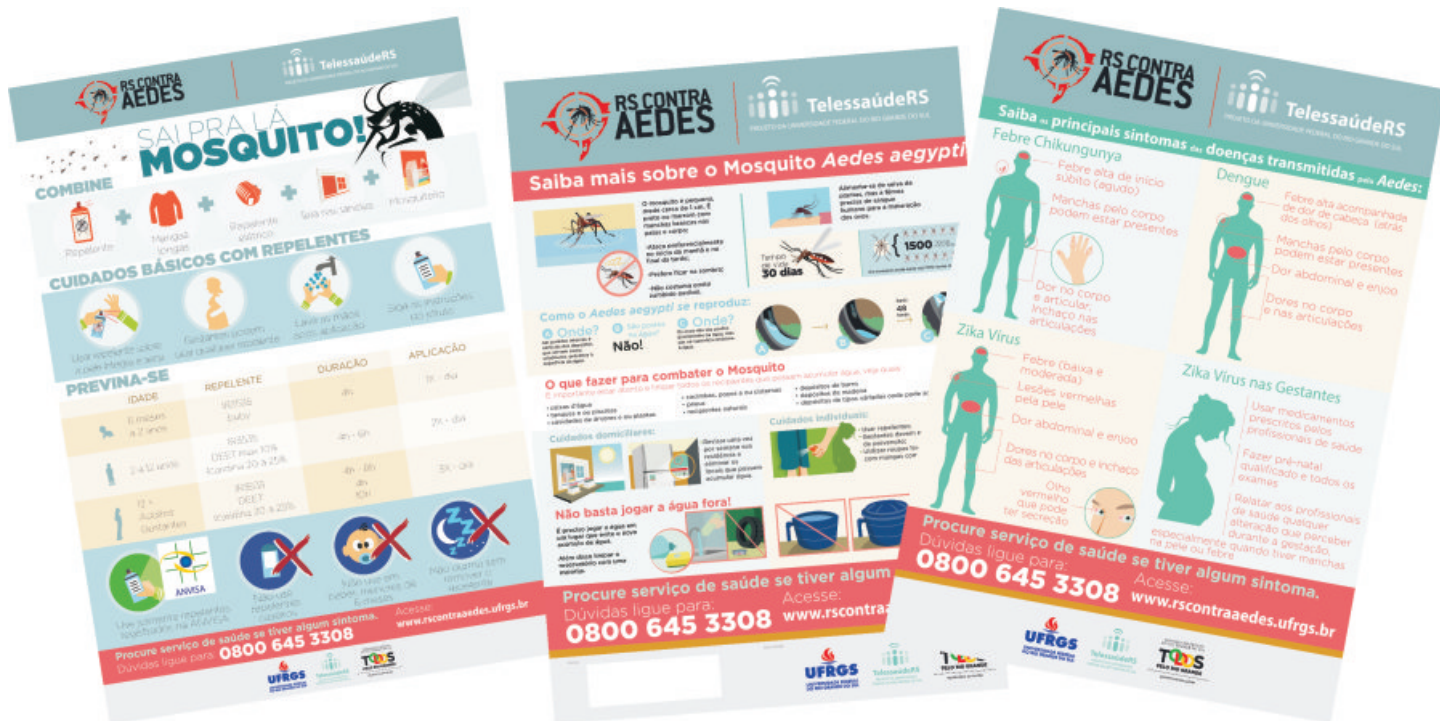
Os materiais e informações utilizados nas divulgações são da Secretaria da Saúde do estado do Rio Grande do Sul.

Nossos porteiros e vigilantes passam por um rigoroso processo de seleção para que tudo aquilo que nos propomos a oferecer em cada cliente, seja entregue. Além disso, fiscais realizam visitas de acompanhamento e orientação, o que garante que dúvidas ou problemas sejam solucionados rapidamente, sem que o serviço seja comprometido.